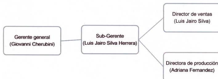
Figura 1. Organigrama de la empresa Zoonatura SAS.

De acuerdo a la información aportada por el usuario, la empresa está conformada por un gerente, un subgerente, un director de ventas y una directora de producción (figura 1).